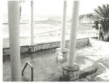
リヴァージュ・スパひきがわ

「ジオセラピー」とは、熊野で行う、各種セラピーのこと。 今回のツアーでは、アロマ、カラーセラピー等を体験。 聖地でカラーブリーディング(色彩呼吸法)&ストレスチェック 色からストレスの原因と解消法がわかってすっきり♪ 山深い熊野の木々やユズでできた手作りの和精油で作る、 アロマミストでゆったり。 じやらん露天風呂一位!関西最高レベルの強アルカリ温泉で つるすべ!波の音を聴きながらほっこり。 大地のパワーと恵みに身も心も満たされ、癒されて、 元氣な自分よみがえる!贅沢日帰りツアーです。